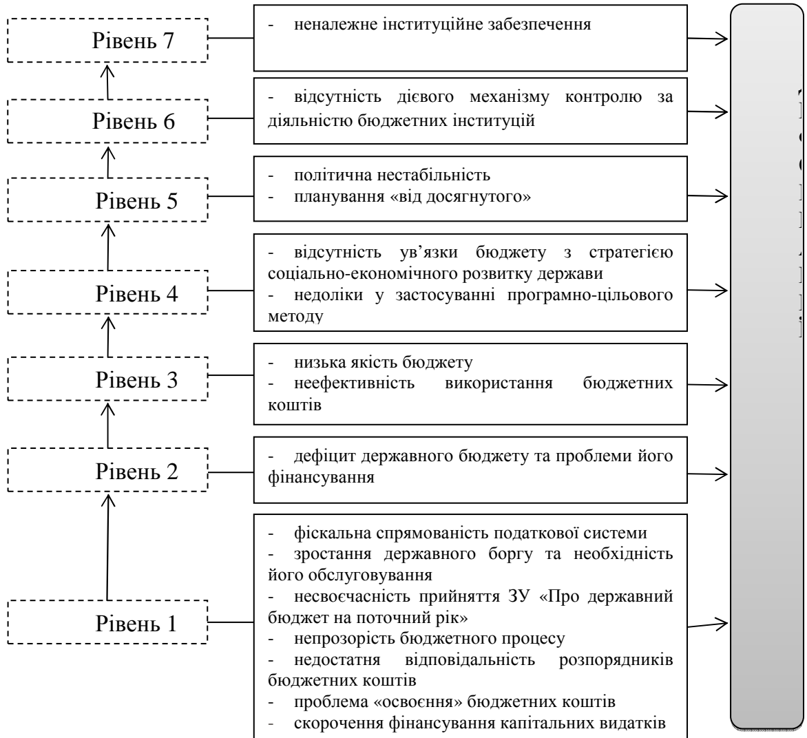
Рис. 2. Модель ієрархії інституційних деформацій бюджетного процесу в Україні

На основі визначеної ієрархії досліджуваних факторів, вважаємо за доцільне, побудувати модель ієрархії інституційних деформацій бюджетного процесу в Україні (рис. 2).