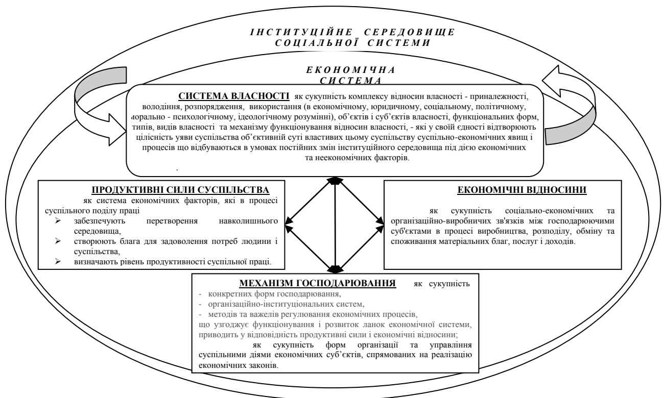
Рис. 1. Економічна система суспільства

методологічних концепцій, які зумовлюють відмінності в дослідженні власності та вирішення визначеного кола проблем шляхом визначення і дослідження системи власності. Використання загальної теорії систем і системного підходу у дослідженні еволюції наукових підходів до аналізу сутності й структури економічної системи та до феномену власності, як фундаментальної категорії господарювання, зумовило авторську думку щодо структури економічної системи суспільства з виокремленням системи власності у взаємодії і взаємозв'язках з іншими підсистемами (рис.1).