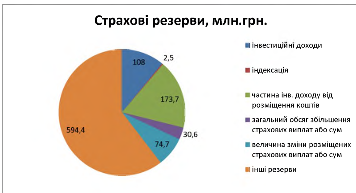
Рис. 3. Структура резервів із страхування життя за 9 місяців 2014 р.

Станом на 30.09.2015 величина зміни резервів із страхування життя становила 1 001,6 млн грн (рисунок 3 і 4), що на 17,7 млн грн більше у порівнянні з аналогічним періодом 2014 року.