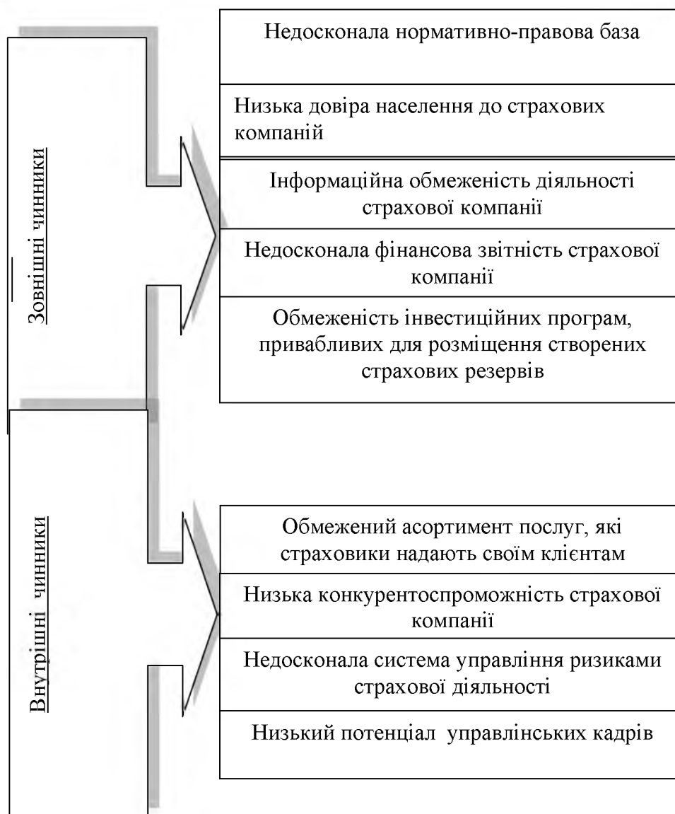
Рис. 4. Чинники, які стримують розвиток ринку страхування життя

Отже, враховуючи вищенаведені чинники та завдання розвитку вітчизняного страхового ринку зазначимо наступні напрями удосконалення функціонування ринку страхування життя в Україні: