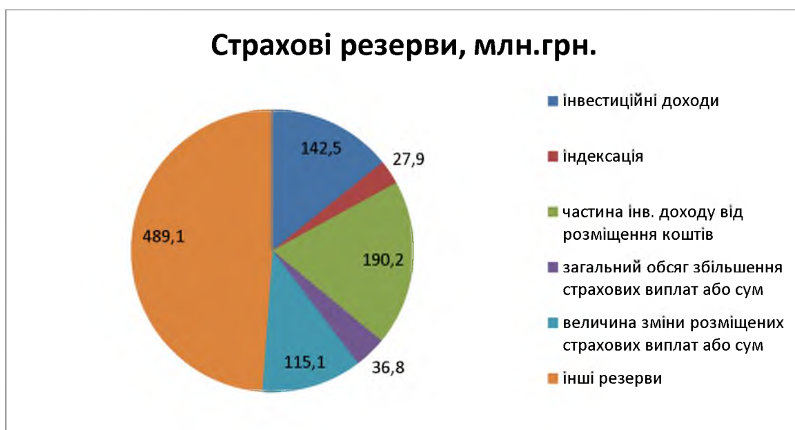
Рис. 3. Структура резервів із страхування життя за 9 місяців 2015 р.

млн грн) задекларовано трьома страховими компаніями "Life" у розмірах 416,2 млн грн, 220,8 млн грн та 119,0 млн грн (41,0%, 21,8% та 11,7% від загального приросту резервів відповідно) [5].