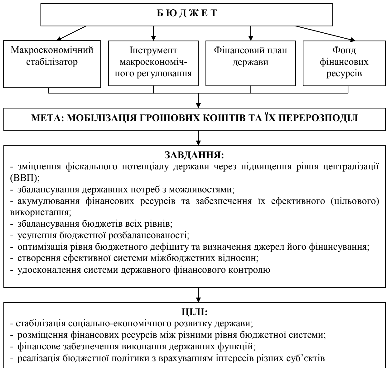
Рис. 3 Роль бюджету в соціально-економічному розвитку держави