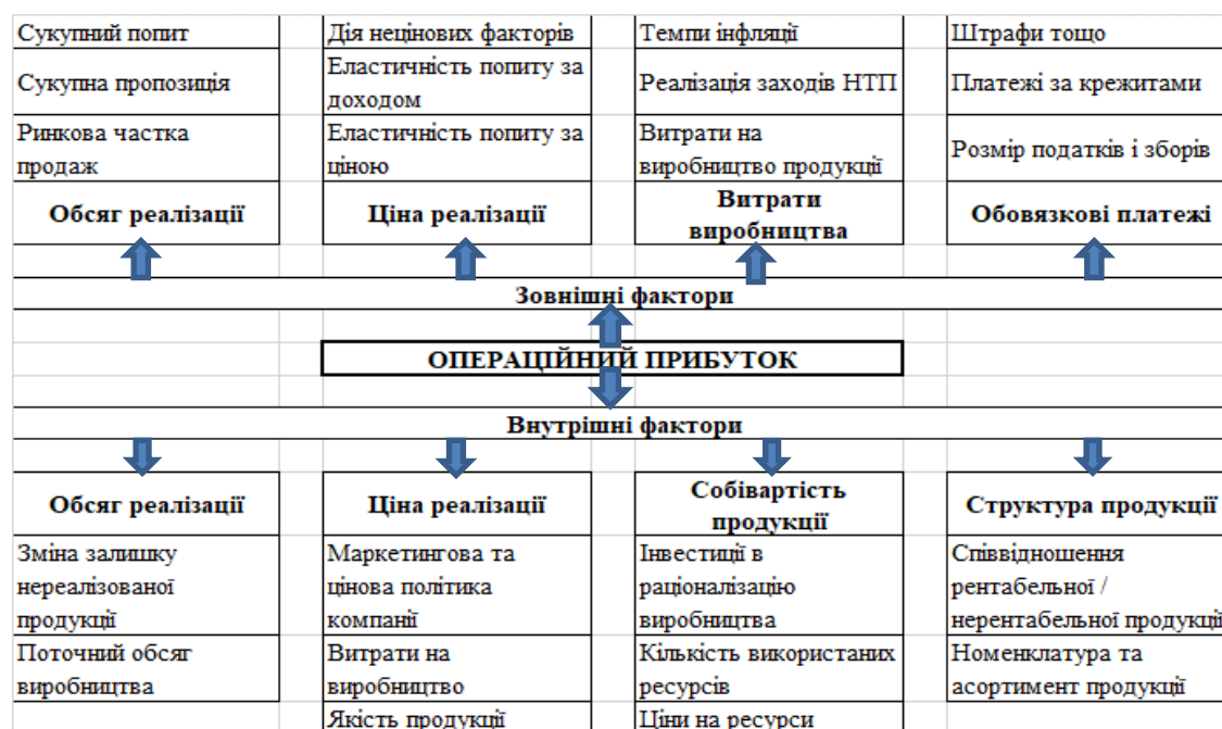
Рис.1. Основні фактори впливу на операційний прибуток підприємства (розроблено автором)

друга – це внутрішнє середовище впливу на прибуток, яка прогнозує очікувані результати діяльності, створює певні індикатори майбутнього економічного стану підприємства (Рис.1).