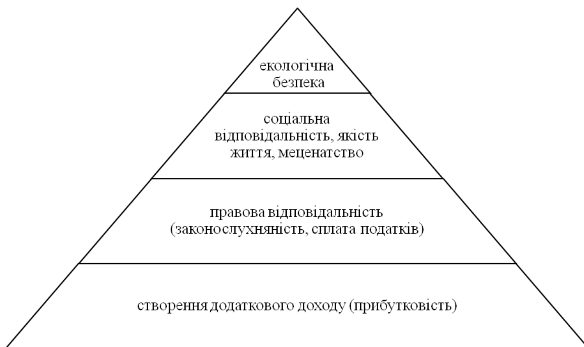
Рис. 3. Ієрархія відповідальності бізнесу перед суспільством

Однак, ієрархія відповідальності бізнесу перед суспільством за сталий розвиток опирається, в першу чергу, на його дохідність, стабільність та захищеність і представлена пірамідою (рис.3):