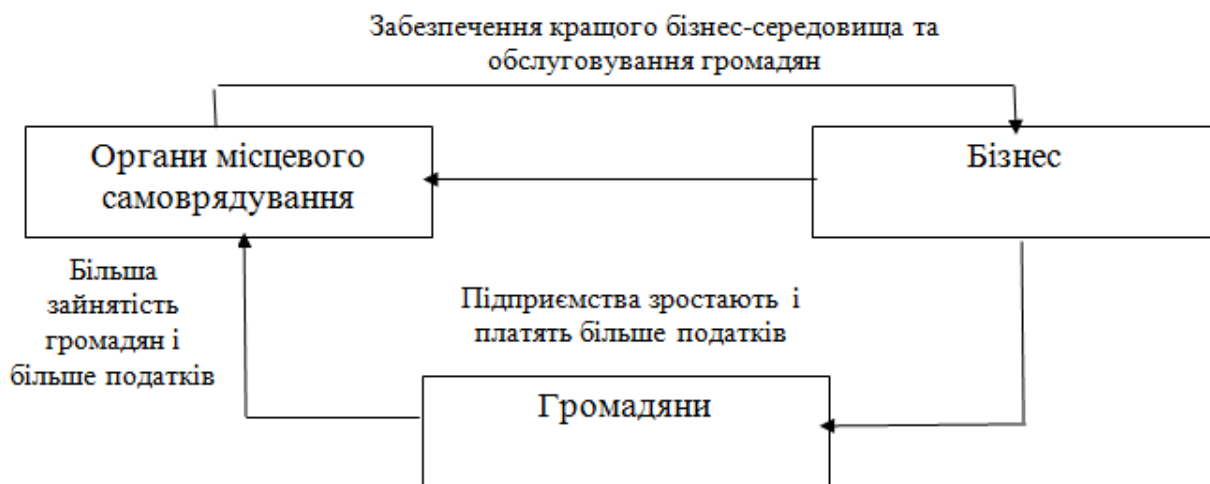
Рис.1. Роль бізнесу в місцевому розвитку

Місцевий економічний розвиток позитивно впливає на всю громаду включно з місцевою владою, бізнесом і громадянами.