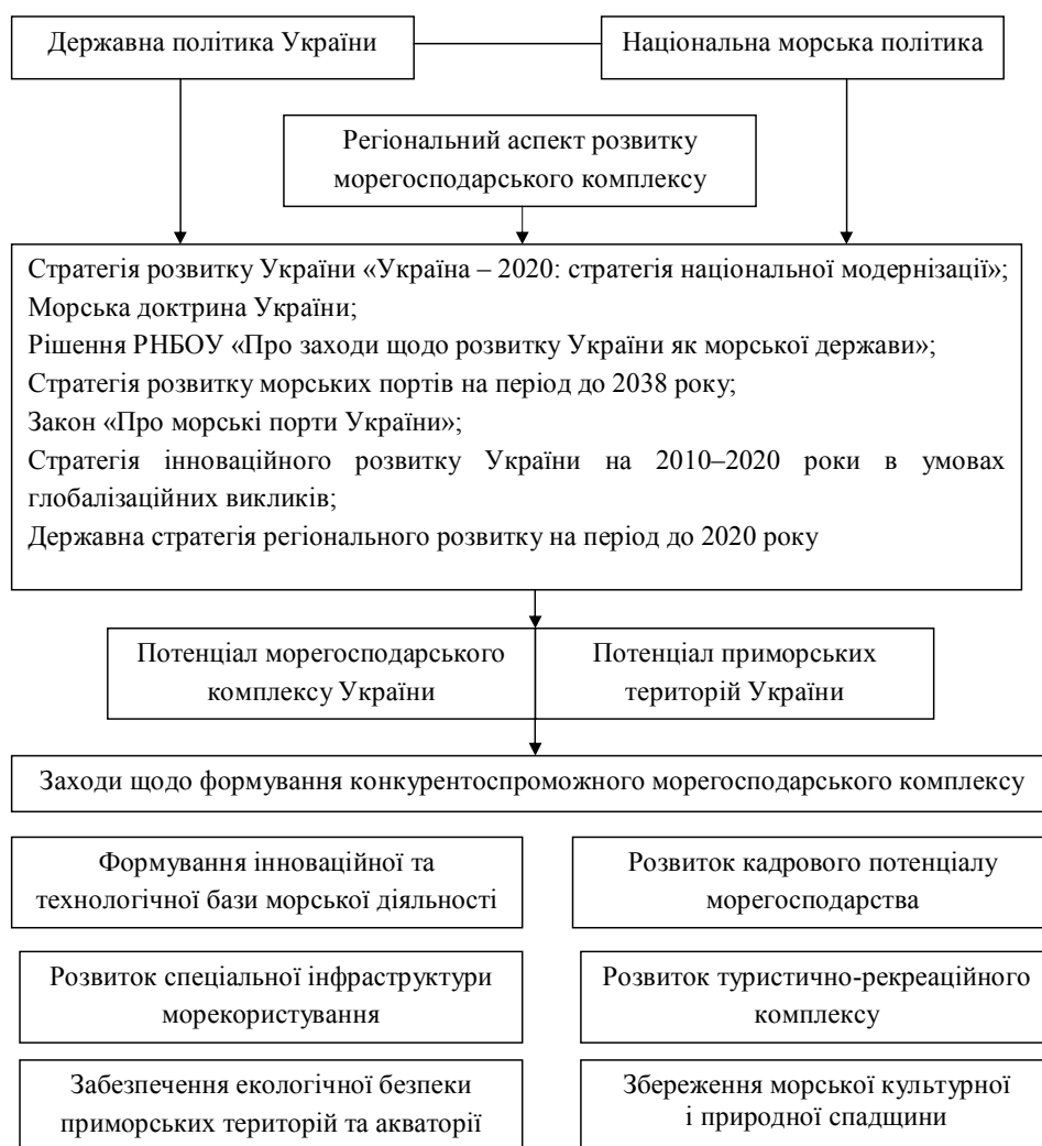
Рис. 2. Механізм формування конкурентоспроможного морегосподарського комплексу

збереження морської культурної і природної спадщини, у тому числі популяризація морської спадщини, інформаційно-просвітницька, наукова і видавнича діяльність, освіта і виховання молоді з орієнтацією на морські професії, розвиток морських меморіалів, музеїв, архівів, бібліотек, колекцій, історичних міст, поселень та фортифікаційних споруд, інших рухомих і нерухомих об'єктів історико-культурної спадщини.