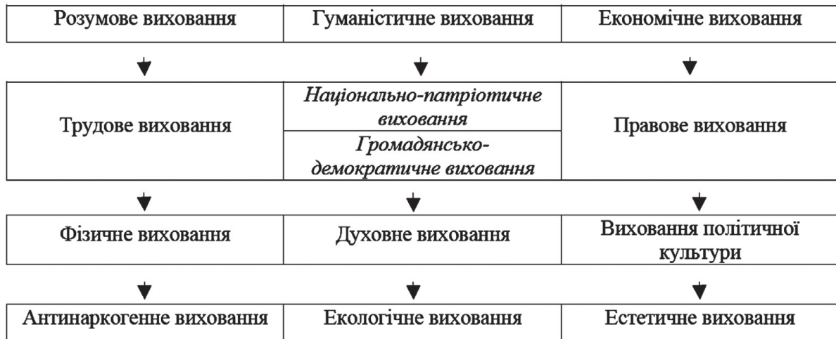
Рис. 1 Ключові напрями змісту виховного процесу у ВНЗ

Виходячи з уже зазначеного, на сучасному етапі розвитку українського суспільства доцільно виокремити такі ключові напрями змісту виховного процесу (див. рис. 1)