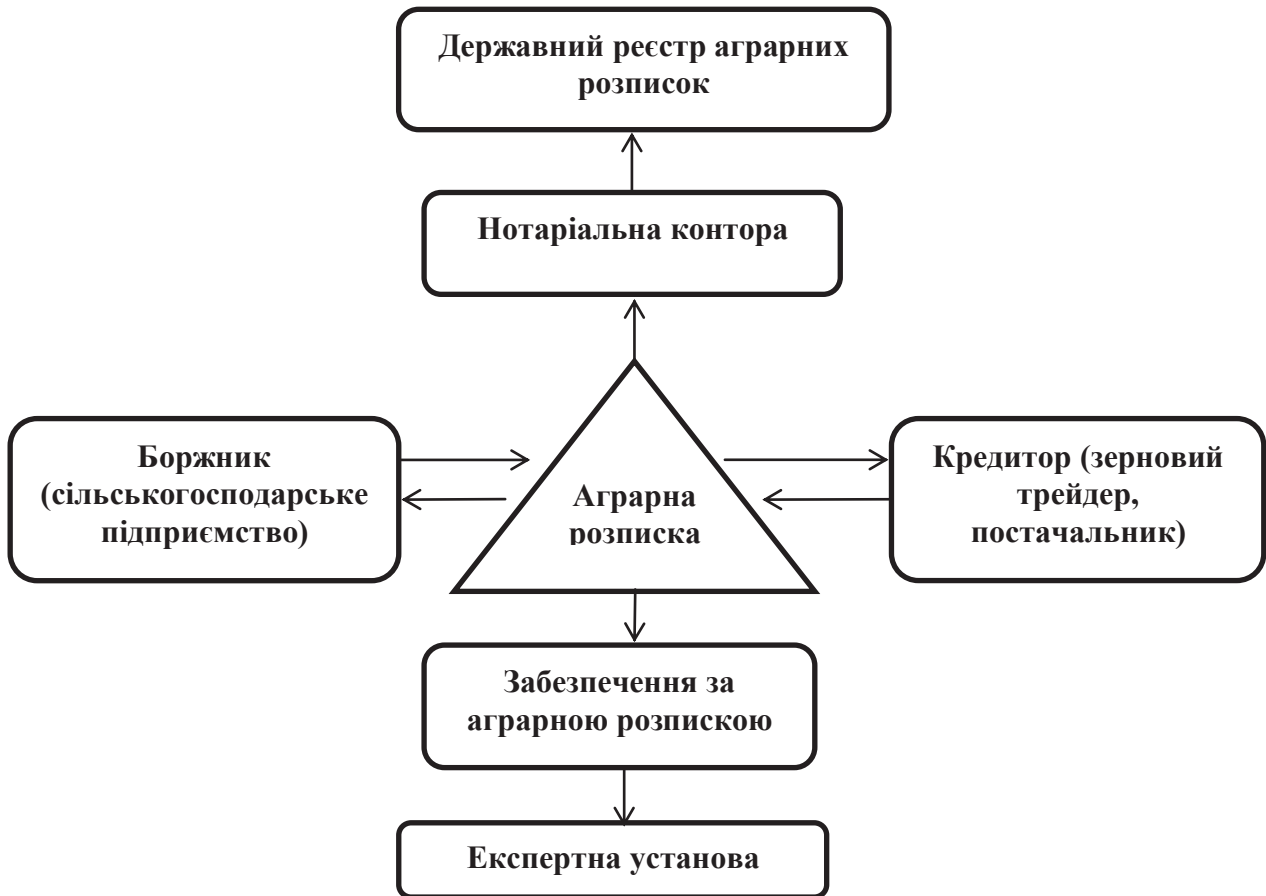
Рис. 2 - Учасники правовідносин із використанням аграрних розписок.

Головними суб'єктами зазначених відносин виступають боржник та кредитор.