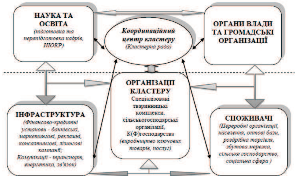
Рис.3 Схема молокопродуктового кластеру

В результаті дослідження було встановлено, що молокопродуктові кластери сприятимуть підвищенню конкурентоспроможності галузі шляхом впливу на конкурентну боротьбу трьома засобами: за допомогою підвищення продуктивності фірм та галузей, які входять до їх складу; шляхом підвищення здатності до інновацій і, таким чином – продуктивності; за допомогою стимулювання нових бізнес-процесів, які підтримують інновації та розширюють границі кластеру. Участь у молочному кластері надає також переваги в доступі до нових технологій, методів роботи або можливостей здійснення постачань. Підприємства-члени кластера швидше дізнаються про прогресивні технології, про доступність нових компонентів і обладнання, про нові концепції в обслуговуванні і маркетингу і т.п. та постійно стежать за цими аспектами, оскільки ці завдання полегшуються постійними взаємовідносинами з іншими членами кластера і особистими контактами. В протилежність цьому ізольований виробник має гірший доступ до інформації і вимушений при цьому