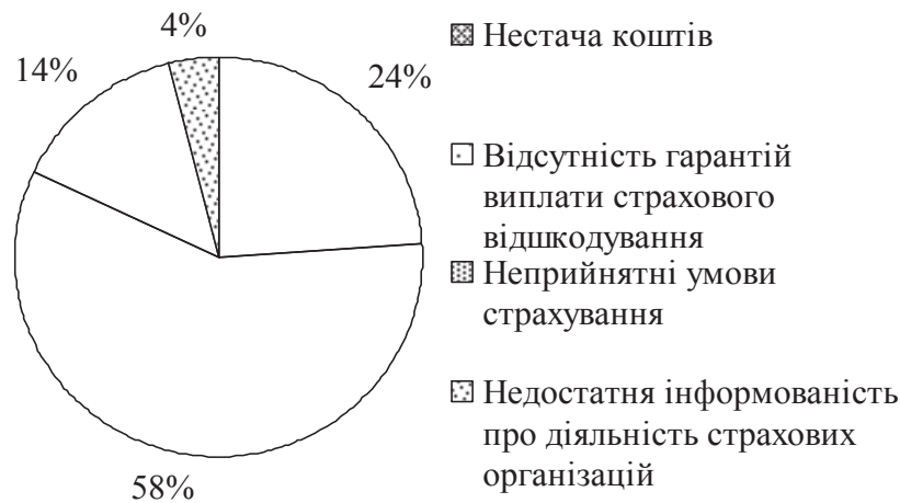
Рис. 2. Розподіл відповідей респондентів щодо проблем, що стримують страховий захист виробництва сільськогосподарської продукції

показник сягає 70-80 %. Недосконалість чинного законодавства у цій сфері призвело до взаємної недовіри у страхувальників та страховиків, а страхування виробниками сільськогосподарської продукції сприймається як вимушений засіб для отримання кредиту чи державної дотації. Більшість респондентів (67 %) сільськогосподарських підприємств Житомирської області відзначили, що не мають можливостей страхувати своє майно (рис. 2).