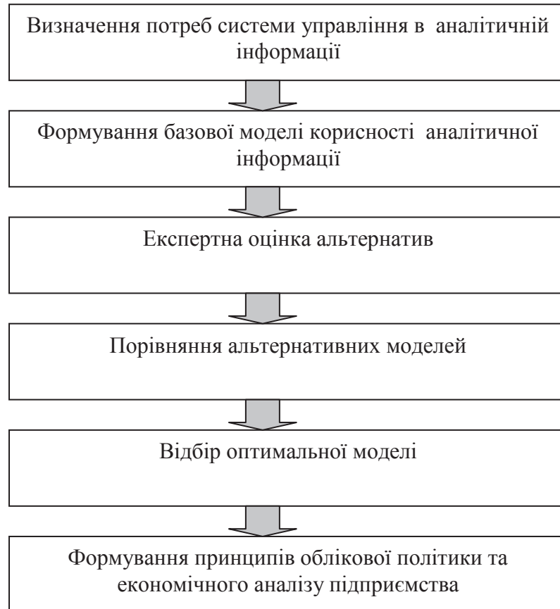
Рис. 3. Модель організації відбору якісних характеристик корисності аналітичної інформації

На третьому етапі суб'єктом управління здійснюється експертна оцінка оптимізації базової моделі корисної аналітичної інформації шляхом формування альтернативних моделей корисності.