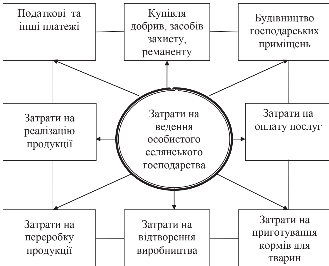
Рис. 2. Основні види затрат на ведення особистого селянського господарства.

препаратів, комбікормів, господарського реманенту; будівництво і ремонт господарських приміщень; затрати на оплату послуг з оранки, культивуації, перевезення продукції, ветеринарного обслуговування, забою тварин; затрати на приготування кормів для тварин; затрати на насіння, корми, молодняк тварин, призначені для відтворення виробництва; затрати на переробку продукції в домашніх умовах, а також на млинах; затрати на реалізацію продукції рослинництва і тваринництва, насамперед транспортні (рис. 2).