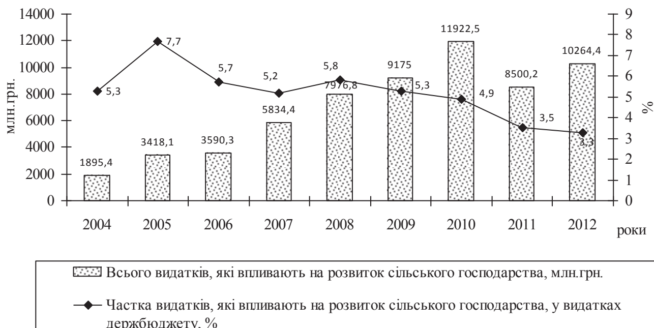
Рис. 4 Динаміка питомої ваги видатків, які впливають на розвиток сільського господарства України, у загальній сумі видатків Державного бюджету