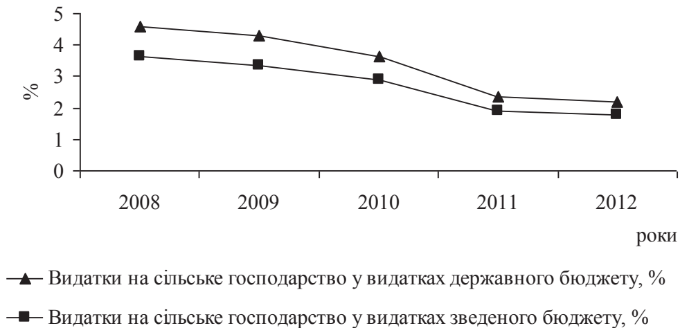
Рис. 2 Динаміка значення сільського господарства у бюджетах України