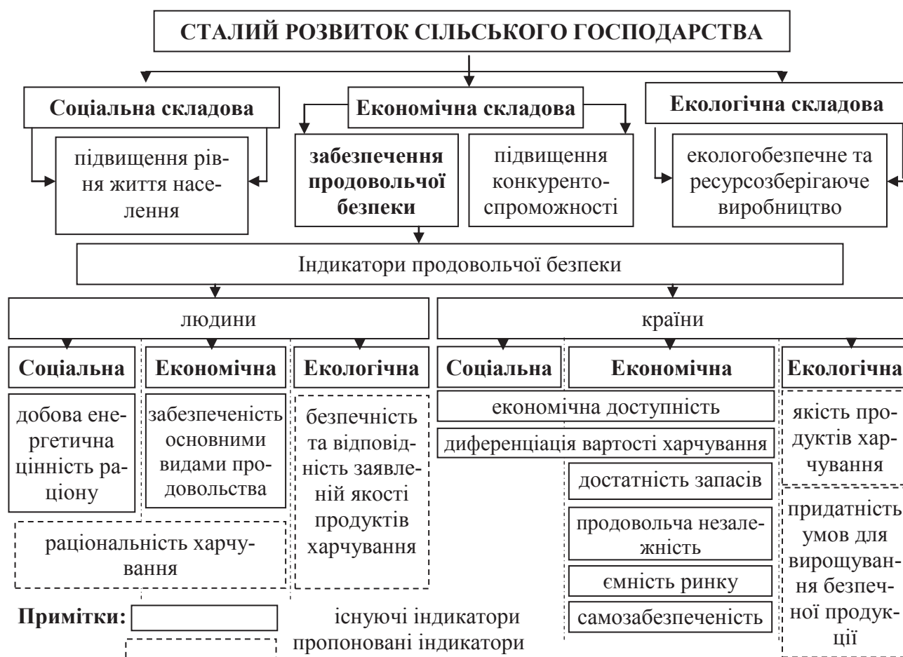
Рис 2. Позиціонування індикаторів продовольчої безпеки відносно базових складових сталого розвитку