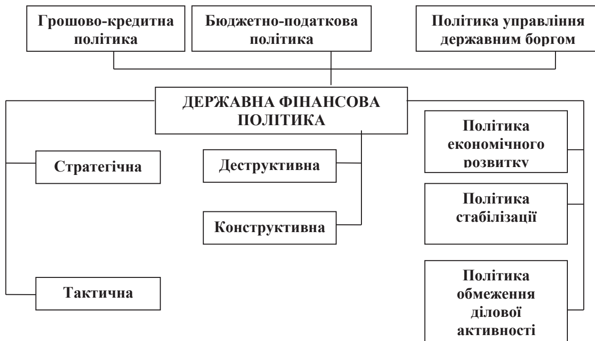
Рис. 3. Модель формування та реалізації державної фінансової політики України

ної фінансової політики та виділено ключові її види – бюджетно-податкова політика, грошово-кредитна політика і політика управління державним боргом (рис. 3).