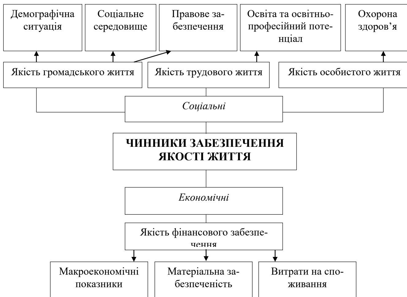
Рис.2. Місце освітньо-професійного потенціалу в системі чинників забезпечення якості життя