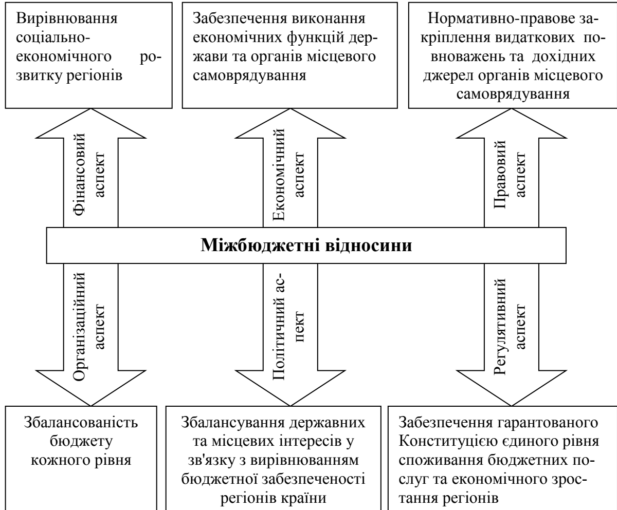
Рис. 1. Підходи щодо визначення сутності міжбюджетних відносин

місцевого самоврядування, встановлення сфери їх спільних повноважень, законодавчого закріплення політики держави у сфері фінансового вирівнювання [1, с. 29].