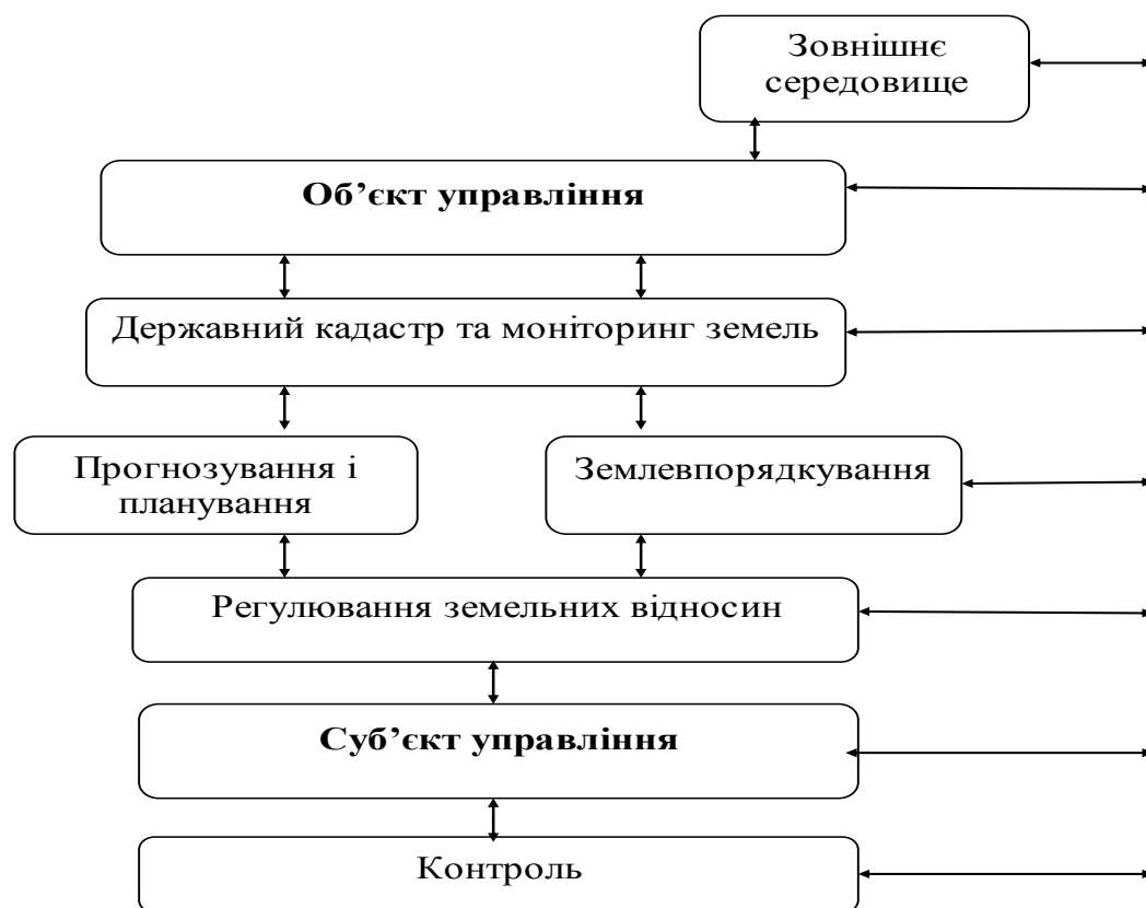
Рис. 1. Загальна схема управління земельними ресурсами