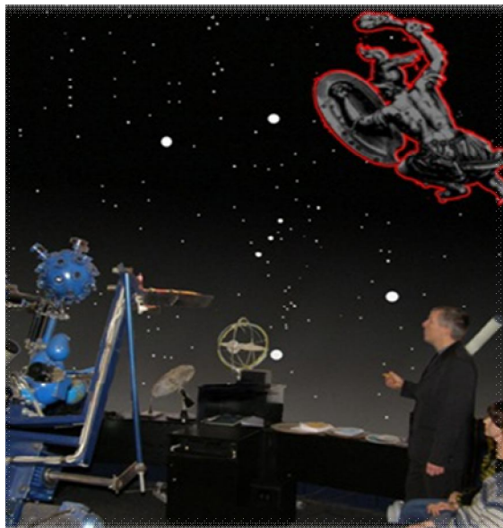
Рис. 3. Фрагмент проведення інтерактивного заняття в НВЦ «Планетарій»

Процес адекватного засвоєння понять полягає в акумулюванні сукупності певних пізнавальних операцій, що переводять суб'єкт навчання у стан розуміння та ціннісних суджень, трансформуючись у накопиченні нових природничонаукових знань.