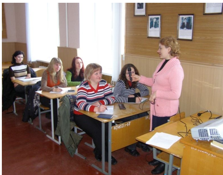
Рис. 1. Фрагмент проведення інтерактивного заняття з методики навчання математики, застосовуючи метод «мікрофона»

факт, що переважна більшість викладачів (і, відповідно, студентів) опанувала їх та використовує їх під час проведення занять. Дедалі ширше використовуються інтерактивні лекції, семінари з евристичним генеруванням ідей (кафедра вищої математики, див. рис. 1). Евристичні технології генерування ідей: «мозковий штурм», «коло ідей», «ажурної пилки», «асоціації (метафори)», «синектики» тощо передбачають генерування ідей усіма учасниками навчального процесу, активізуються інтуїція та уява студентів, відбувається вихід за межі стандартного мислення. На заняттях з фахових методик студенти освоюють навички проектування за допомогою ІКТ навчального процесу в школі (планування уроку, демонстрації у різних режимах (фото, анімаційний, відеоформат), розробка засобів комп'ютерної діагностики [2, с. 293]. На заняттях з фахових методик студенти освоюють навички проектування за допомогою ІКТ навчального процесу в школі (планування уроку, демонстрації у різних режимах (фото, анімаційний, відеоформат), розробка засобів комп'ютерної діагностики.