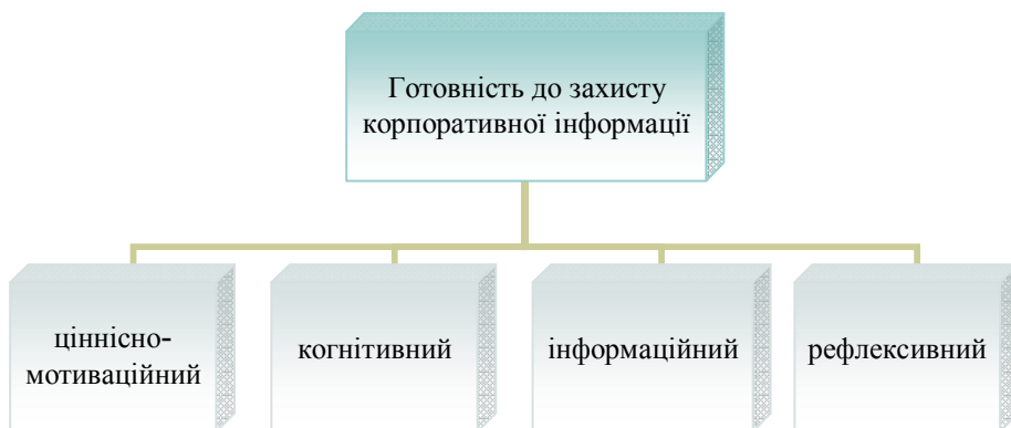
Рис. 1. Модель готовності фахівця економічного профілю до роботи в умовах корпоративної системи захисту інформації

Готовність фахівця економічного профілю до роботи в умовах корпоративної системи захисту інформації ми розглядаємо як складну інтегральну характеристику професійної діяльності, яка визначає його здатність відповідально і компетентно працювати з корпоративною інформацією як з цінністю, не розголошувати її зміст, не використовувати її в особистих цілях, зберігати в належних умовах, компетентно виконувати всі посадові інструкції щодо доступу та збереження інформації. В моделі готовності виділяємо ціннісно-мотиваційний, когнітивний, інформаційний, рефлексивний компоненти (рис. 1).