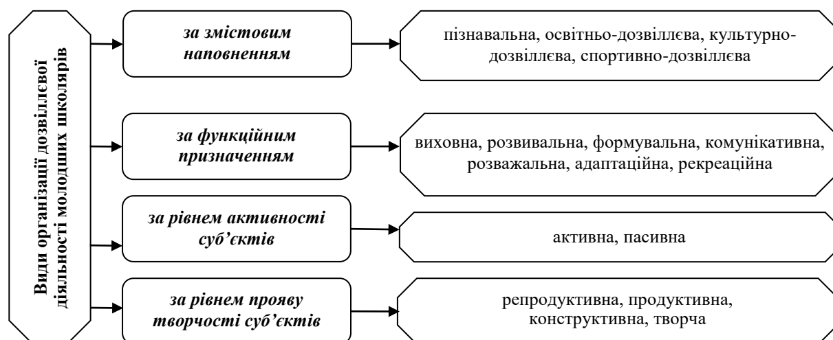
Рис. 1. Класифікація видів організації дозвіллевої діяльності молодших школярів

Таким чином, проведений аналіз засвідчив неоднозначність підходів учених до визначення видів дозвілля й дозвіллевої діяльності особистості загалом та дитячого дозвілля зокрема. На нашу думку, така нечіткість виокремлення видів дозвіллевої діяльності унеможливорює продуктивне вирішення цієї проблеми. З огляду на це, для класифікації видів організації дозвіллевої діяльності дітей молодшого шкільного віку нами обрано наступні критеріальні ознаки: зміст дозвіллевої діяльності, функційне призначення, активність та рівень творчості її суб'єктів (рис. 1).