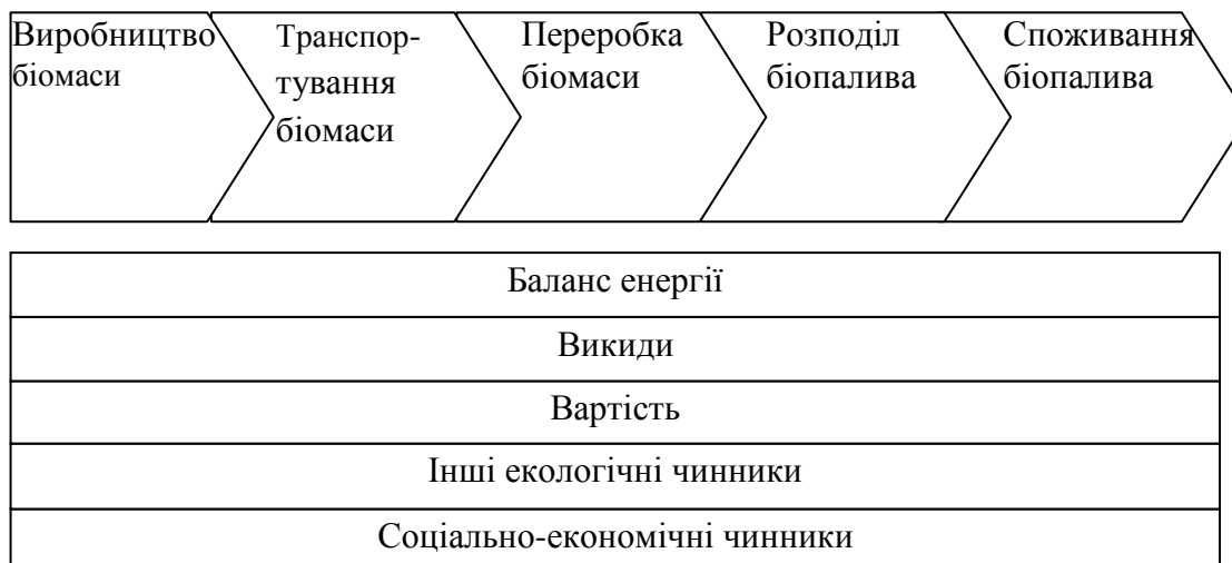
Рис. 1 Життєвий цикл та чинники виробництва та використання біопалива [3, С. 24]

У аграрному секторі здебільшого споживається тепла, електрична енергія та рідинне паливо, одержані з невідновлюваних ресурсів. Поряд з цим використання близько 30% біомаси на енергетичні потреби дозволить сільськогосподарським товаровиробникам досягнути енергонезалежності. Комплексні рішення агробіоінженерних систем виробництва та використання біопалив дозволять частково або повністю замінити традиційні енергоносії. Ці системи можна впроваджувати на рівні агропромислових підприємств (рис. 2).