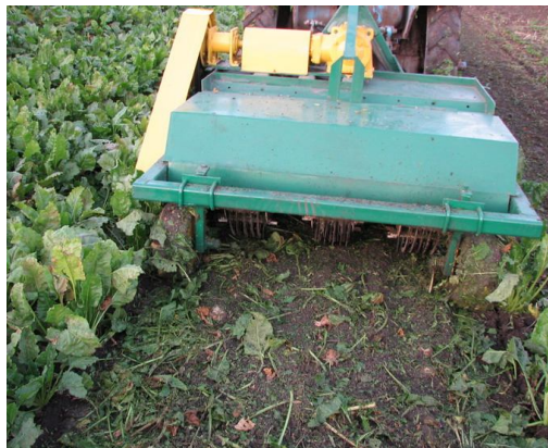
Рис. 2. Експериментальна машина для відокремлення гички

копірним очисником. Машина складається з двох горизонтальних роторів (рис. 2). Передній, ріжучий ротор, виготовлений з використанням базових деталей та вузлів машини КДР - 1,5. На кожен рядок встановлено 8 П-подібних, шарнірно закріплених ножів для зрізання гички на фіксованій висоті відносно поверхні ґрунту.