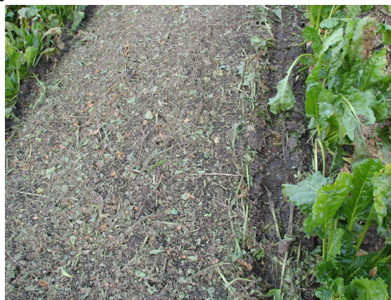
Рис. 3. Вигляд поля після проходу експериментальної машини для відокремлення гички

За ріжучим ротором встановлено ротор доочисника з шарнірно встановленими прогумованими робочими елементами. Частота обертання ріжучого ротора 1500 \text{ хв}^{-1} , очисного – 950 \text{ хв}^{-1} . Конструкція машини передбачає можливість встановлення пасивних гичкопідійомників, що дещо покращує відокремлення гички. Гичка подрібнюється робочими органами ріжучого та очисного валів і розподіляється в рядках та міжряддях (рис.3). Завдяки подрібненому стану легко просіюється на сепаруючих робочих органах коренезбиральної машини, не забруднюючи сировину зеленою масою. Напрямок обертання переднього і заднього валів проходить за рухом машини.