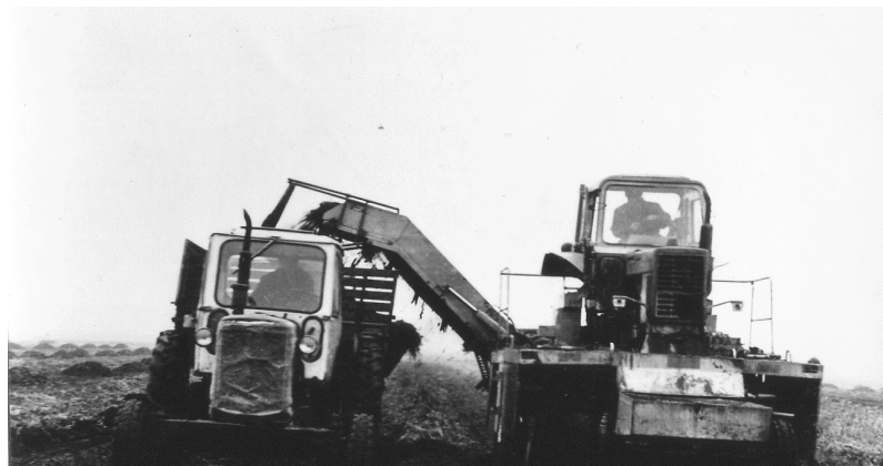
Рис. 3. Загальний вигляд коренезбирального комплексу

Загальний вигляд коренезбирального комплексу МКК-6+МТЗ-50+2ПТС-4 під час проведення порівняльних випробувань наведено на рис. 3.