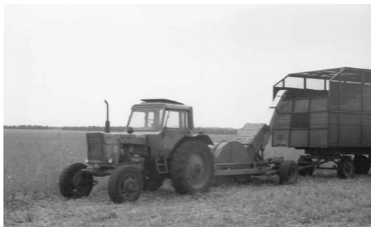
Рис. 1. Технологічна схема (а) і загальний вид (б) причіпної збиральної машини