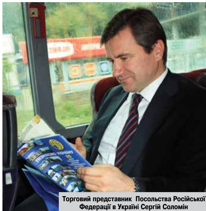
Торговий представник Посольства Російської Федерації в Україні Сергій Соломін