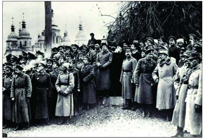
Проголошення III Універсалу Центральної Ради. У центрі зліва направо стоять лідери Української революції: Симон Петлюра, Володимир Винниченко, Михайло Грушевський

Проголосивши державний суверенітет, Україна прагнула до розповсюдження за кордоном свого дипломатичного представництва. Багато уваги справі теоретичного обґрунтування розвитку міжнародних контактів української державності почав приділяти визнаний ідеолог відродження національної державності М. Грушевський. Мріючи про перетворення України в сучасну державу на шляхах демократичного розвитку, він ретельно аналізував у своїх роботах 1918 р., що