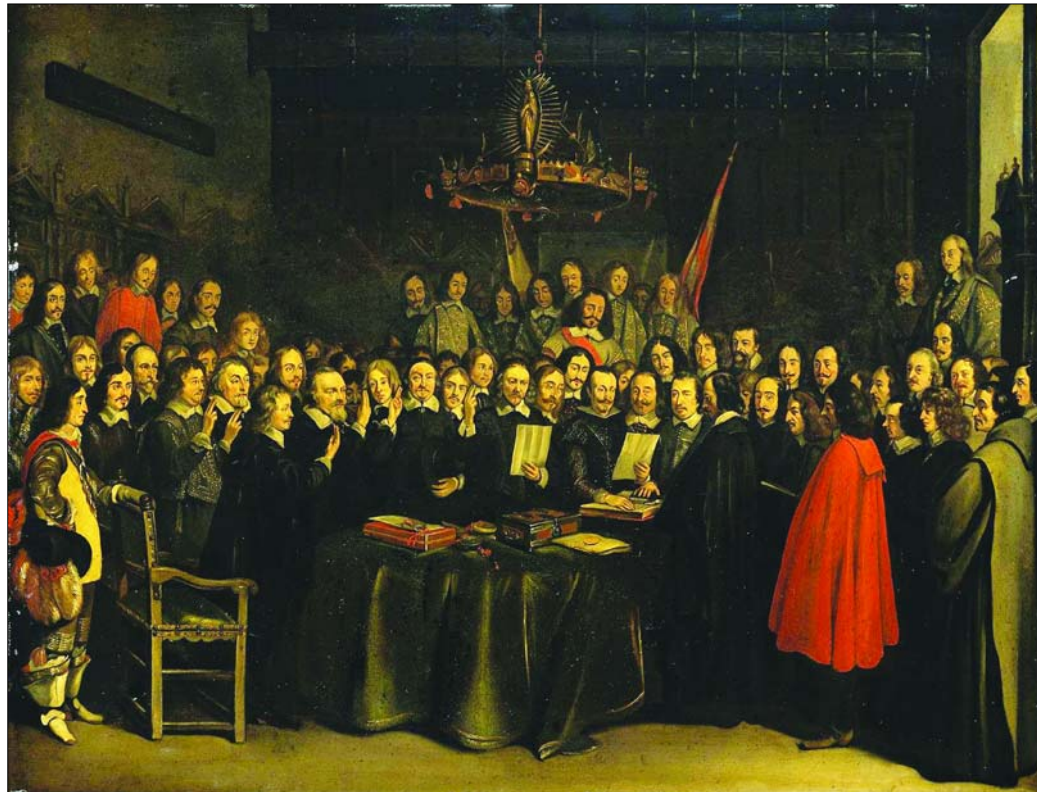
Підписання Мюнстерського договору 15 травня 1648 року. Г.Терборх. Друга половина XVII століття