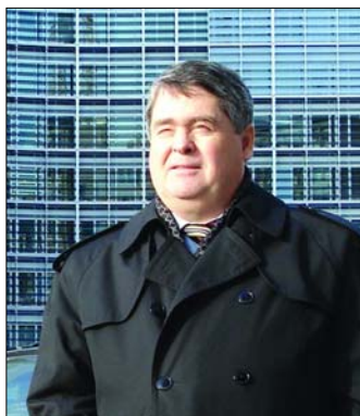
Сергій ШЕРГІН, доктор політичних наук, професор, завідувач кафедри регіональних систем та європейської інтеграції Дипломатичної академії України при МЗС