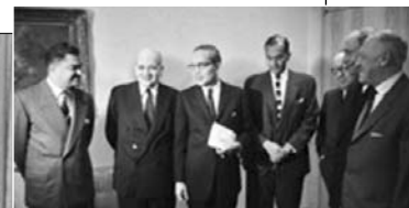
Генеральний секретар ООН У Тан під час Карибської кризи 1962 року сприяв успішному переговорному процесу