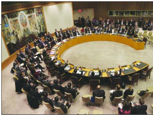
Засідання Ради Безпеки ООН. Члени РБ ООН 31 січня 1992 року дали доручення Генеральному секретареві ООН розробити рекомендації у сфері превентивної дипломатії

Продовження статті читайте в наступному номері «З.С.»