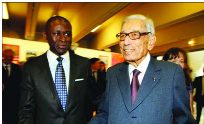
Бутрос Бутрос-Галі, Генеральний секретар ООН (1992-1996 рр.). Автор доповіді «Порядок денний для миру»

У цьому документі Б. Галі виклав ідею комплексного підходу до забезпечення безпеки у світі, який розкривається через чотири основні види діяльності: 1) превентивна дипломатія (preventive diplomacy); 2) підтримання миру (peacekeeping); 3) миротвор-