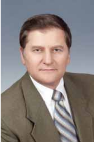
Андрій КУДРЯЧЕНКО, директор «Державної установи Інститут всесвітньої історії НАН України», доктор історичних наук, професор

Побачила світ значуща книга міжнародного колективу провідних політологів, дипломатів та істориків «Світові інтеграційні процеси в умовах трансформації міжнародних систем», підготовлена у стінах Дипломатичної академії України й опублікована під грифом МОНУ.