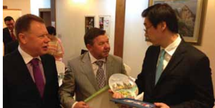
П.О. Кривонос (у центрі) під час урочистого прийому спілкується з Послом України в РК В.С. Мармазовим і президентом «Корейської фундації» Ю Хьюн-сеок

Учасники програми відвідали Багатофункціональне Адміністративне місто Седжонг (його також називають містом майбутнього), яке невдовзі стане новим місцем розташування органів центральної влади Республіки Корея; стали гостями Школи державної політики та управління Корейського інституту розвитку (KDI School of Public Policy and Management), а також побували в Університеті Юнгнам, де відбулася презентація політичної ініціативи «Рух Семаул» (Рух «Нове Село»). На завершення програми відбувся культурний тур містом Сеул.