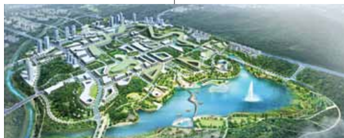
«Місто майбутнього» Седжонг – нове місце розташування центральної адміністрації та «силіконової долини» Республіки Корея