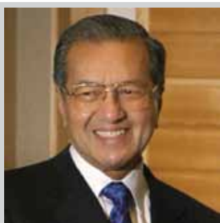
Махатхір бін МОХАМАД, 1981-2003 – Прем'єр-міністр Малайзії. Автор моделі розвитку, яка відкидає неоліберальні принципи, завзятий критик західної економічної політики та ідеолог самовизначення мусульманського світу