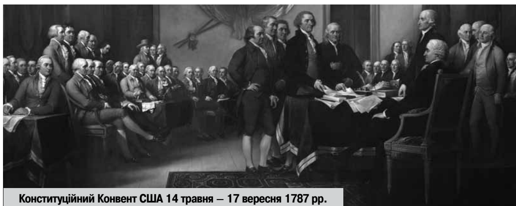
Конституційний Конвент США 14 травня – 17 вересня 1787 рр.

Дебати про форму і структуру майбутньої держави мали бурхливий характер. Справа доходила до прямих образ і погроз [5, с. 93-126]. Однак у творців майбутньої конституції вистачило політичної мудрості й такту поєднати кращі сторони обох проєктів і створити на їх основі єдиний документ — «Коннектикутський компроміс», що примирив супротивників [6]. Він закріпив гарантії прав малих штатів, що дало змогу перейти до подальшого, більш спокійного обговорення майбутньої форми правління. Конвент 26 липня перервав своє засідання на час роботи комітету з питань деталей проєкту. Було запропоновано підготувати початковий варіант конституції. До 6 серпня проєкт був готовий. Він складався з преамбули і 23 статей, які увібрали в себе пропозиції «Вірджинського» і «Нью-Джерсійського» планів, а також окремі норми Статей Конфедерації та конституцій штатів. В основу цього документа було покладено такі політико-правові принципи та ідеали.