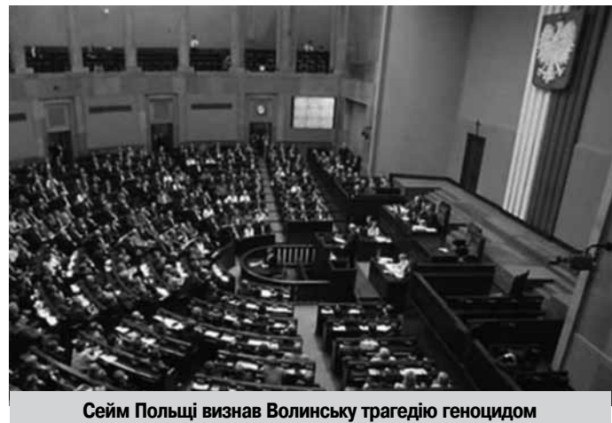
Сейм Польщі визнав Волинську трагедію геноцидом