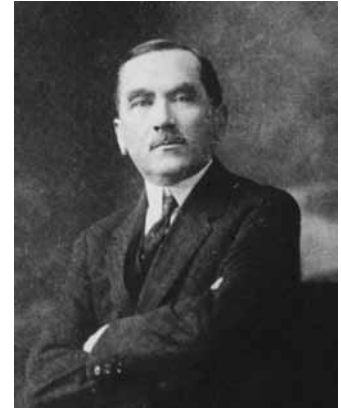
Роман Дмовський (1864-1939), політичний діяч і публіцист, засновник націоналістичного політичного угруповання «Табір великої Польщі»

Серед них перш за все виокремимо Юзефа Пілсудського (1867-1935 рр.), який у своїх поглядах пройшов шлях від концепції федералізму — вільної співпраці вільних народів (шляхом розчленування Росії та виокремлення народів у незалежні держави), до пацифікації (фактично, колонізації й антиукраїнської політики місцеві адміністрації