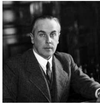
Генрік Юзевський (1892-1981), державний діяч II Речі Посполитої, художник, історик

Суть іншого напрямку — поміркованого федералізму — представлено громадським діячем Болеславом Лімановським — полягає в розробці ідеї федерації народів: «вільних із вільними», «рівних із рівними». «Поляки, українці, білоруси, литвини вільним і загальним голосуванням постановляють чи жити їм у федеративній державі, чи відокремитись кордонами».