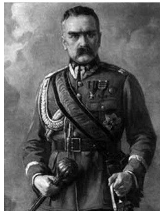
Юзеф Пілсудський (1867-1935), перший голова відродженої польської держави

Перша світова війна піднесла визвольний рух усіх