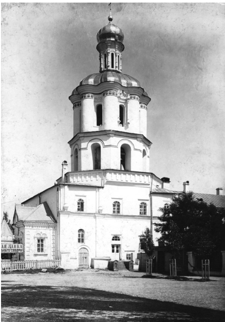
Будинок Колегіуму в Чернігові. Південно-західний фасад. Фото початку ХХ ст.

Строение это, находясь в таком расстроеном положении, непременно требует фундаментального исправления, которое будет стоить приблизительно той суммы, какая потребовалась бы на постройку вновь этого здания. Составление сметы на исправление этого здания я полагаю бесполезным, потому что это исправление не обеспечит устойчивости строения, которое, как объяснено выше, повреждено во всех частях [14, арк. 9–10].