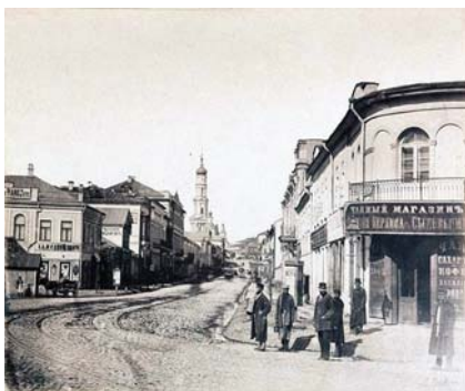
Рис. 2. Успенський собор. Зображення XIX ст.