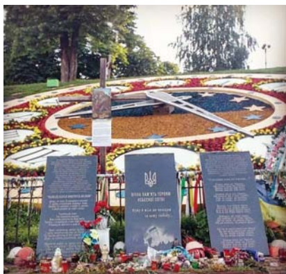
Рис. 4. Годинник-меморіал

Висновки. На відміну від усталених наукових дисциплін і широких міждисциплінарних програм дослідження феномену візуального («візуальна культура», візуальна антропологія, візуальна соціологія тощо), культурологічний підхід має ґрунтуватись на значно ширшому предметі і методологічному горизонті. Його предметом може бути названий взаємозв'язок між візуальністю та культурою в глобальному чи локальному вимірах. Методологічним горизонтом водночас є інтерпретація специфіки візуальних конструкцій як вияву глибинних чи поверхових соціокультурних трендів й ідентифікація процесів зворотного впливу різних аспектів візуального на культуру. Він має застосовувати раціональне співвідношення кількісно-якісних дослідницьких інструментів (за аналогом із контент-аналізом). Статистичні методи є важливими щодо збирання автентичних і репрезентативних джерел для дослідження, якісні — для її внутрішньої критики. Результати дослідження якнайкраще визначають показники візуальної привабливості тих чи інших культурних феноменів як відображення співвідношення між різними складовими культурної системи, рівня її модернізованості. А кількісне вимірювання історико-культурної еволюції знакових для певної сучасної культури проявів візуального дозволяє визначитись із рівнем