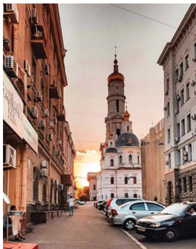
Рис. 1. Успенський собор. Зображення XXI ст.