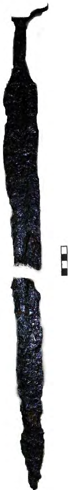
Рис. 2. Меч № 2