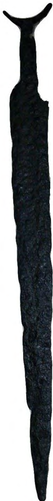
Рис. 1. Меч №1