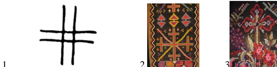
Рис. 9. Знак креста, «по сторонам». 1. Орнамент времен Триполья. 2-3. Традиционный свастичный орнамент старинных молдавских ковров (Фото: 3 – выставка 2018 г., Национальный Исторический Музей, Кишинэу, РМ)