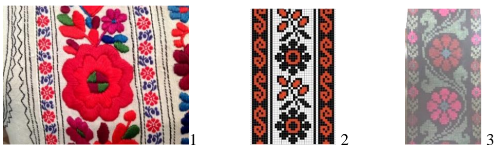
Рис. 6. Солярность цветка. 1. Яворовская вишивка, Львовская область. 2. Традиционный мотив украинской вишивки. 3. Ручной ковер, XX в., Хынчештский р-н, РМ

В этом украшении, которое обвивает дизайнерскую юбку видим сочетание трех стихий – воды (волнистые линии), земли (две равные горизонтальные линии), и огня (представлена солярность цветком-Руже с круглыми ягодами, рожь от роза). Это единство традиционно выражено красно-сине-черным колоритом (Рис. 6).