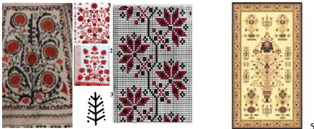
Рис. 3. Орнаменты на текстиле. 1-2. – полотенца из Винницкой обл., XX в. 3. Дерево жизни у трипольцев. 4. Вышивка Подолья. 5. Дерево жизни в коврике-сувенире, АО Флоаре-Карпет, РМ

Также дерево жизни встречается и в различных текстах, и в народной обрядности соседствующих этносов (достаточно вспомнить атрибуты свадебного действа и крещения, поминальных ритуалов). Более того, эта мифологема встречается и в современном фольклоре, в рассказах (нарративах), в граффити. Ипостаси ее проявления в текстах может быть самая разнообразная флора: лес, сад, женские и мужские деревья (но традиционно это вишня, яблоня, дуб, ясень и др.). В орнаменталистике также этот образ со временем несколько заслоняет образ Берегини-Матери, которая сохраняет выразительные растительные элементы, и вазонов, символизирующий уже Дерево Рода. Вазоны характеризуются поли вариативностью, в зависимости от районирования (Рис. 4). Согласно исследованиям Л. Моисей, в культуре молдаван образ ели валентен архаичному мотиву древа жизни 17 .