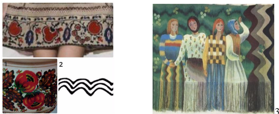
Рис. 5. Трипольский орнамент. 1.Петриковская роспись. 2. Трипольский орнамент «вода бежит». 3. «С работы», гобелен, М. Сака-Рэчилэ, РМ