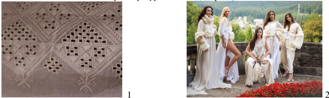
Рис. 13. Традиционные ткани. 1. Скатерти с ромбами, звездами, зубцами, Ровенская область, XX в., Украина. 2. Этно-Коллекция «Корни», Е. Негруцэ, ГПУ Крянгэ, 2018, худрук. Анна Симак

Привлекает внимание – орнамент , в котором образуются различия между двумя треугольниками. Его называют «колодец», который является символом связи между двумя мирами. Он часто встречается и в фольклорных текстах, как одна из форм мифологемы воды. Кроме того, берет свои истоки с трипольской культуры, где не случайно означает «предел».