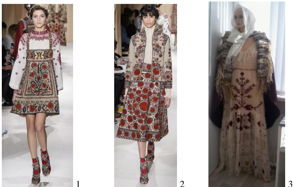
Рис. 2. 1-2. – древние этнокоды в коллекциях современных дизайнеров (слева – от Valentino, справа – от молодого молдавского дизайнера, ГПУ Крянгэ, Музей худфака)

Как и положено, образ, к которому чаще всего обращаются все современные дизайнеры текстиля и художники, много вариативное древо жизни либо мировое древо . Оно предстает перед нами и в коллекциях Валентино, являясь центральным изображением на одном из платьев (Рис. 2. 1-2). Этот образ как мифологема границ, характерна для большинства народов мира. В психологии украинцев это дерево воплощало в себе представление о трюйственности мира, где корни – подземное царство (загробной жизни), ствол – земная жизнь (Яви) и крона – небесный мир (Правь – рай). Так, дерево объединяет прошлое, настоящее и будущее, стоит вне времени и пространства, является центром мира, является всей Вселенной.