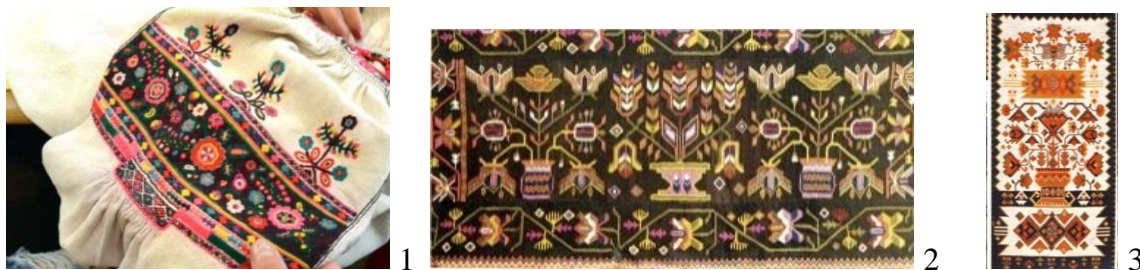
Рис. 4. Дерево жизни. 1. Ивано-Франковск, Украина. 2. Коллекция НМЭИ, РМ. 3. Дерево жизни, XX в., РМ

Также дерево жизни встречается и в различных текстах, и в народной обрядности соседствующих этносов (достаточно вспомнить атрибуты свадебного действа и крещения, поминальных ритуалов). Более того, эта мифологема встречается и в современном фольклоре, в рассказах (нарративах), в граффити. Ипостаси ее проявления в текстах может быть самая разнообразная флора: лес, сад, женские и мужские деревья (но традиционно это вишня, яблоня, дуб, ясень и др.). В орнаменталистике также этот образ со временем несколько заслоняет образ Берегини-Матери, которая сохраняет выразительные растительные элементы, и вазонов, символизирующий уже Дерево Рода. Вазоны характеризуются поли вариативностью, в зависимости от районирования (Рис. 4). Согласно исследованиям Л. Моисей, в культуре молдаван образ ели валентен архаичному мотиву древа жизни 17 .