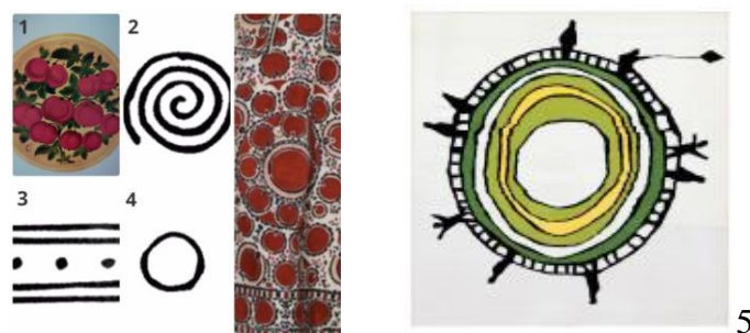
Рис. 7. Трипольские символы. 1. Петриковская роспись. 2. Трипольская «спираль времени». 3. Трипольский символ «оберег». 4. Символ «глаз» («видеть») в трипольцев. 5. Гобелен, реализованный в рамках проекта «Возвращение к традициям», 2014, ГПУК, РМ