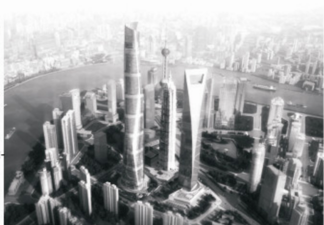
Рис. 1. Соціальна ідентифікація суб'єктів за допомогою естетизації форми

Китай сьогодні складає конкуренцію ОАЕ та США по кількості і якості нових амбітних хмарочосів. Золота будівля успіху (Башта Джин Мао) висотою в 421 м розташована біля Шанхайського Всесвітнього фінансового центру, який у 2008 році визнан найкращим хмарочосом світу. Тут же зараз будується Шанхайська башта в 682 м. Це конкуренція новітніх будівельних технологій, нових способів життя, конкуренція коштів і демонстрація успішності корпорації за допомогою архітектури, бо бажаєш внушити довіру клієнту, покажи своє багатство, стабільність і перевагу над іншими. І заради цього будівлі, як і у XIII ст., зростають вгору.