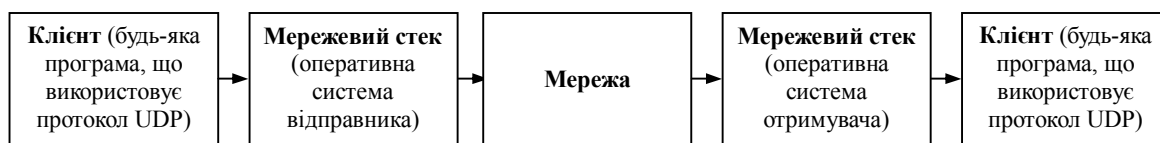
Рис. 1. Схема побудови каналу обміну даними