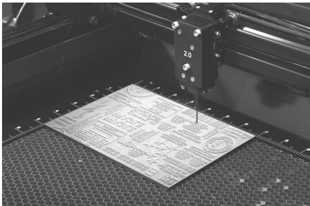
Рис. 2. Зображення на гумі, яке формується лазерним променем

Отримане таким чином зображення на гумі вирубуються за допомогою пуансона або вирізається ножицями, очищається від часток гуми (пилу) – кліше готове. Додаткові операції з оброблення кліше не потрібні.