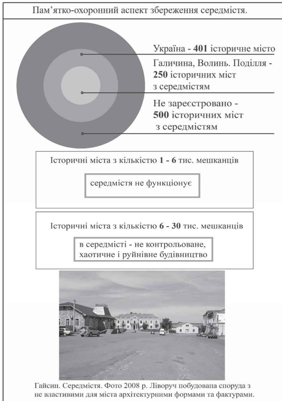
Рис. 3. Пам'ятко-охоронний аспект збереження середмістя

У прикладі середмість історичних міст України, критеріями визнання їх пам'ятками містобудування виступатимуть: стан збереженості планувальної та об'ємно-просторової структури, традиційна забудова пов'язана з періодами розвитку, стилями та етнокультурними чинниками, комплекс оборонних споруд (підземні та наземні релікти), важливі сакральні об'єкти (церкви, костели, каплиці, синагоги), малі архітектурні форми (криниці, придорожні фігури, каплиці), місця пам'яті (території пов'язані з втраченими важливими спорудами середмістя, видатними людьми, які вплинули на розвиток регіону та країни, літературними та образотворчими фіксаціями), характеристики ландшафту та мальовничі панорами вулиць, площ та цілого середмістя. Згідно з попередніми характеристиками, на думку автора, в реєстр пам'яток містобудування варто зарахувати середмістя