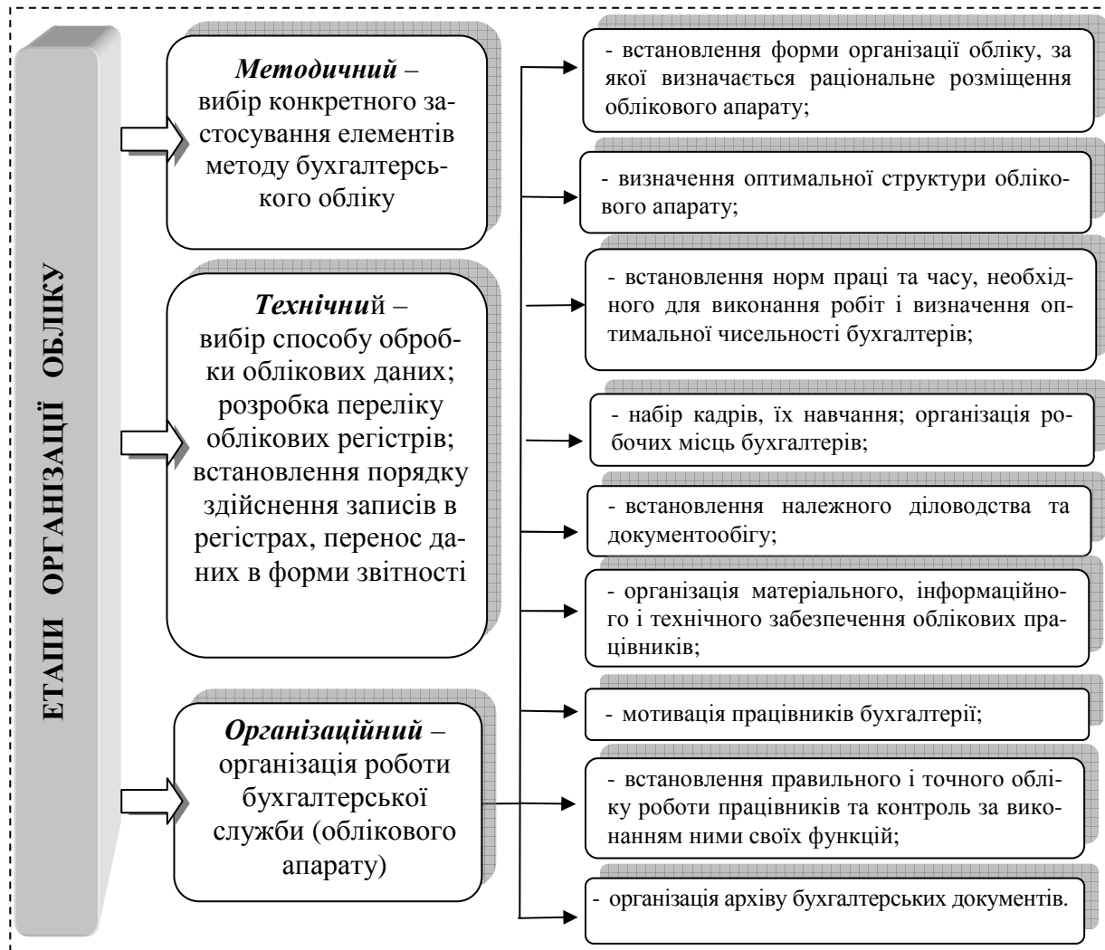
Рис. 1 Основні етапи організації обліку на підприємстві

Раціональна організація обліку базується на принципах, які направлені на досягнення єдиної мети – забезпечення оперативною, достовірною та перевіреною інформацією внутрішніх та зовнішніх користувачів (рис. 2) [6, 10].