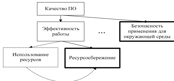
Рисунок 2 – Вариант (2) включения характеристик "грин" в МКПО

ве подхарактеристики вместо использования ресурсов характеристики эффективность . "Грин" подхарактеристика влияние на устойчивое развитие и безопасность применения для окружающей среды входит в качестве подхарактеристики в характеристику безопасность (security) .