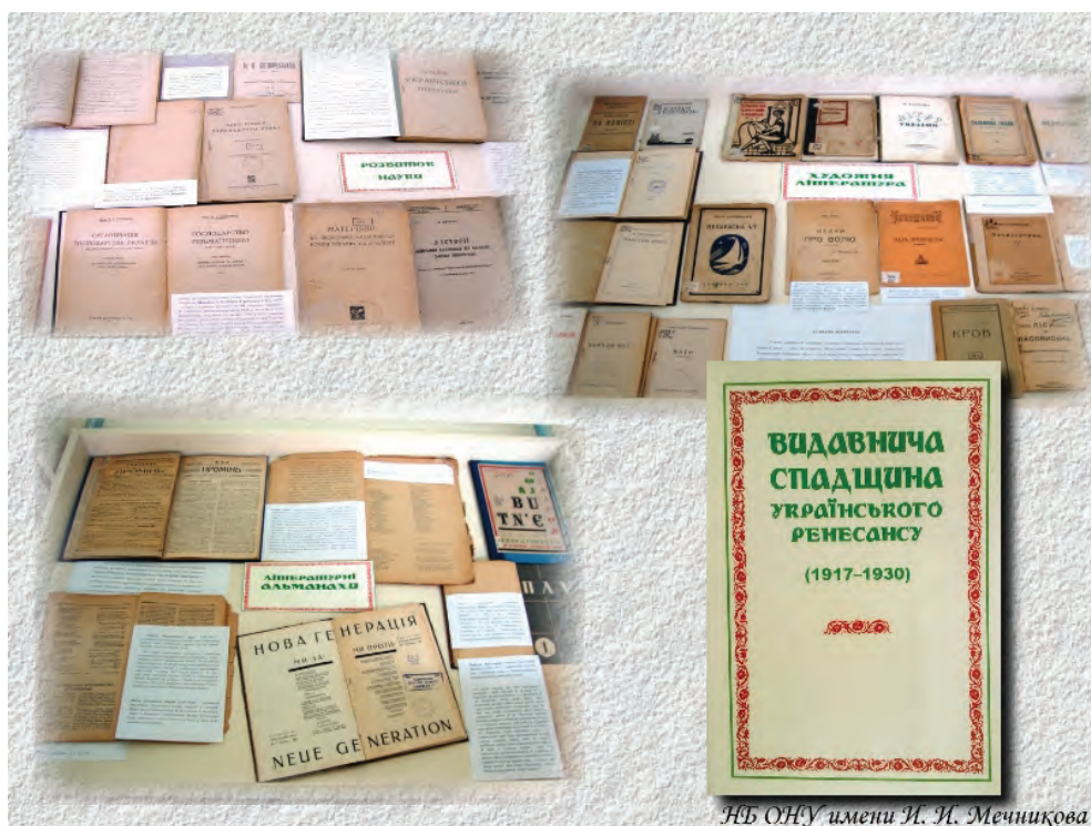
НБ ОНУ імені І. І. Мечникова

Редкие украинские издания 1920-х гг. иллюстрируют расцвет разных областей культурной жизни молниеносной эпохи национального возрождения: от научных поисков к достижениям искусства, от агитационной прессы до детской литературы. Особого внимания достойны раритетные украинские издания 1917-1919 гг. одесских издательств «Народний стяг» (1917-1918), «Українська книжка» (1918-1919) та Видавничої комісії при Українському секретаріаті (1919).