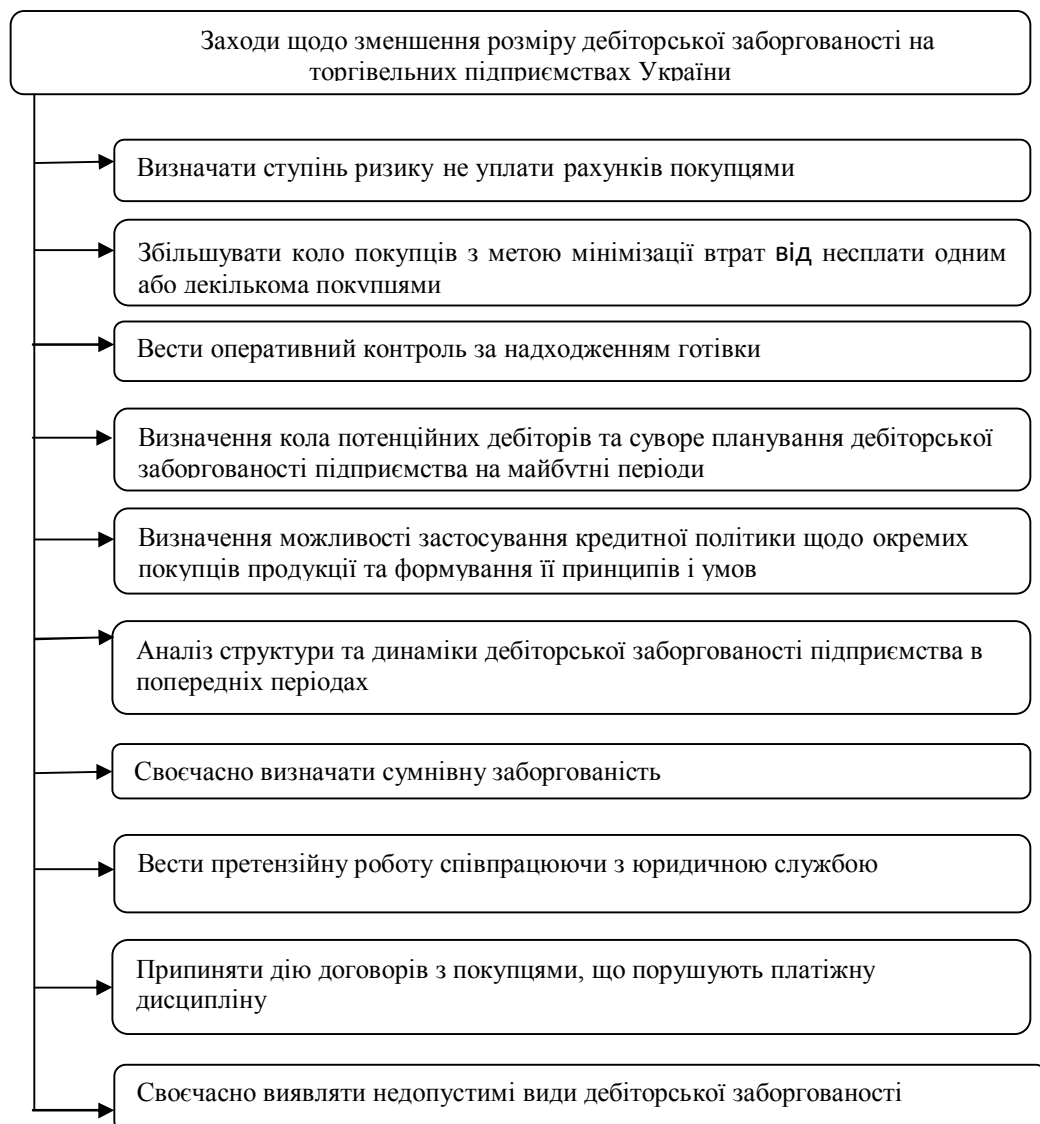
Рис. 3 Заходи щодо зменшення розміру дебіторської заборгованості