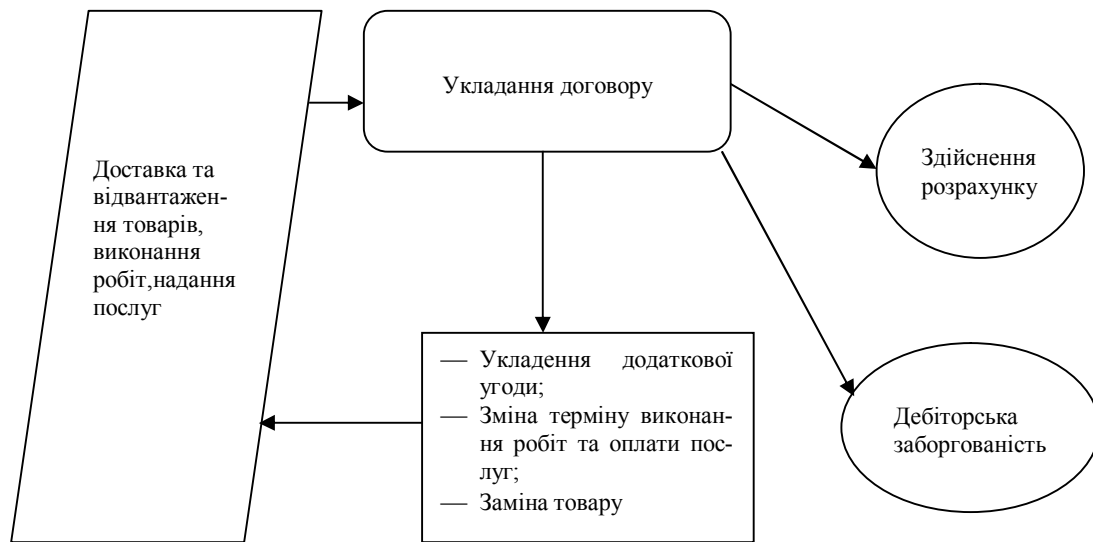
Рис 2. Алгоритм виникнення дебіторської заборгованості при реалізації товарів