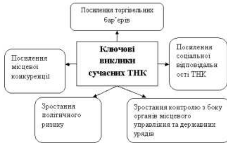
Рис. 1. Виклики сучасних ТНК

1. Посилення торгівельних бар'єрів. Згідно даних Світової Організації Торгівлі, торгівельна політика стає більш жорсткою та набуває протекціоністського характеру. Так, країни "великої двадцятки" посилюють бар'єри, запроваджуючи нові протекціоністські заходи, такі як експортні обмеження на різні продукти, нові квоти та тарифи. З 2008 року урядами цих держав було введено понад 1,5 тис. нових обмежувальних заходів, а усунуто лише 387, крім того спостерігається посилення імміграційного контролю. Як наслідок, спостерігається порушення ланцюгів постачання ТНК, а також здатність користуватися альтернативними ланцюгами постачання (включаючи підвищення стандартів працевлаштування та екологічної політики). Особливо це стосується вертикально інтегрованих корпорацій [6].