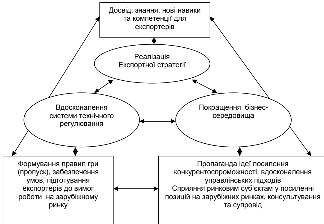
Рис. 2. Концепція крос-секторальної стратегії взаємодії у контексті вдосконалення системи технічного регулювання

Однак, сама по собі система технічного регулювання країни не здатна забезпечити підвищення конкурентоспроможності ринкових суб'єктів чи країни в цілому, проте вона може сприяти цьому. Тому потрібно налагодити зв'язок між основними державними програмними документами, які покликані реформувати різні, проте споріднені сфери – бізнес-середовище, експортну політику та систему технічного регулювання. Пропонуємо розробити та реалізувати крос-секторальну стратегію, що об'єднує три складових – реалізацію Експортної стратегії, вдосконалення систему технічного регулювання та лібералізацію бізнес-середовища, що відображено на рис. 2.